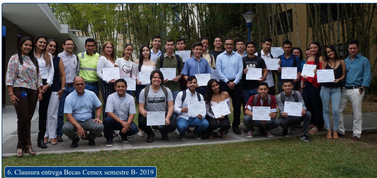
6. Clausura entrega Becas Cemex semestre B- 2019