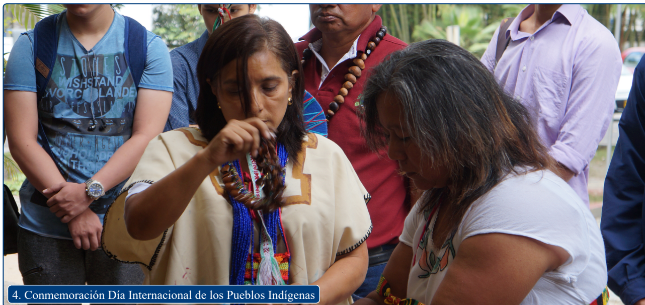
4. Conmemoración Día Internacional de los Pueblos Indígenas