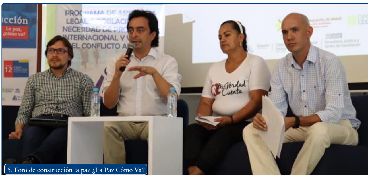
5. Foro de construcción la paz ¿La Paz Cómo Va?