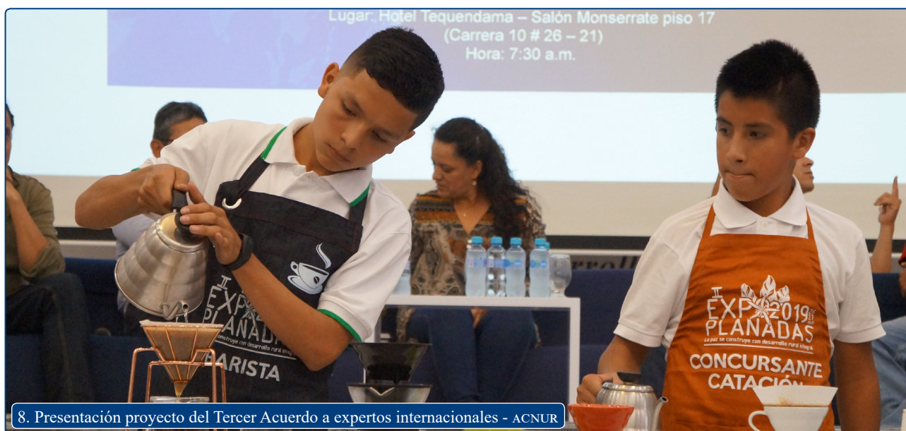
8. Presentación proyecto del Tercer Acuerdo a expertos internacionales - ACNUR