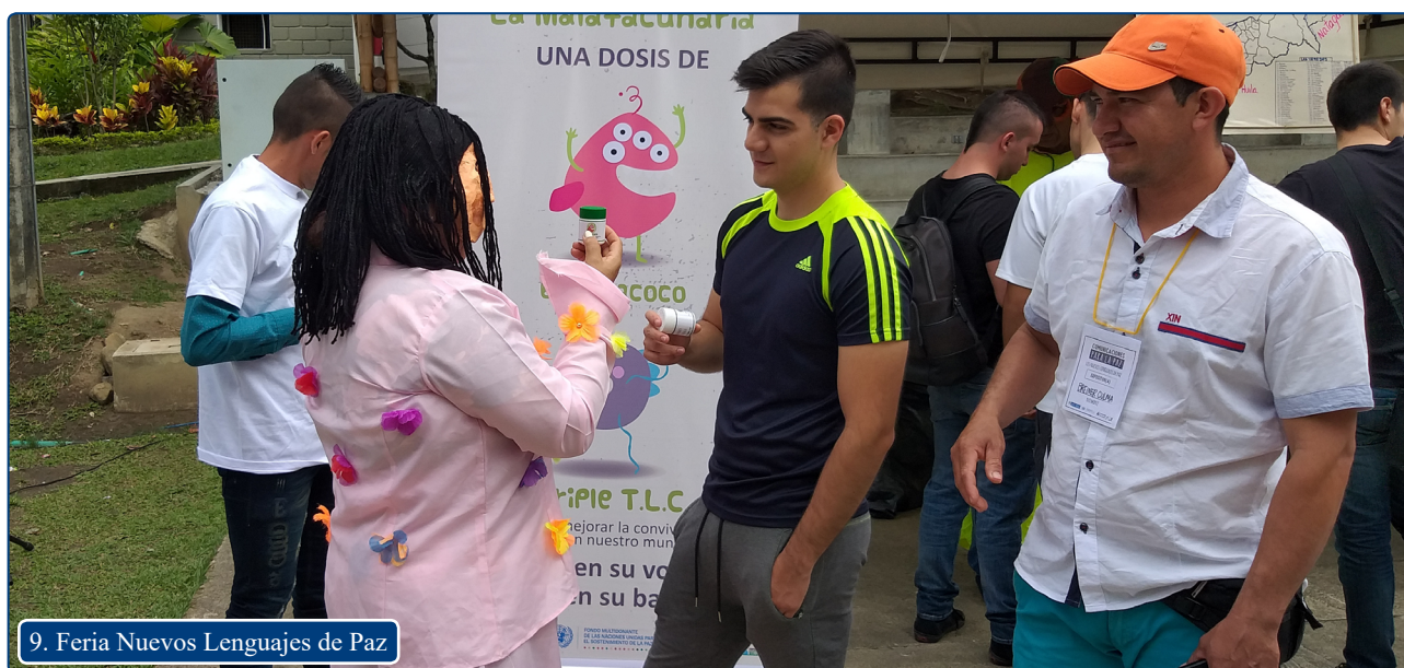
9. Feria Nuevos Lenguajes de Paz